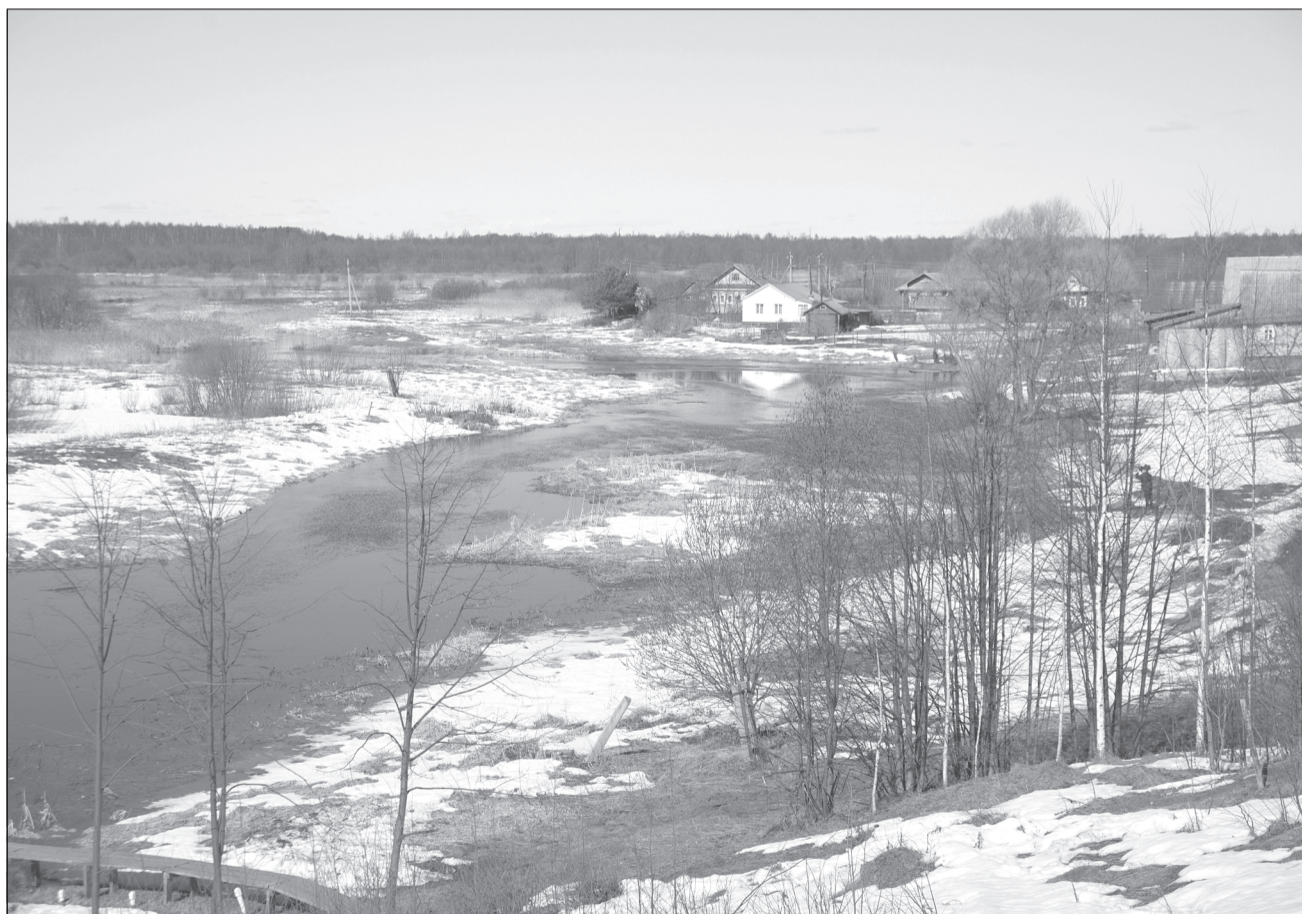
Пик весеннего половодья ожидается во второй - третьей декаде апреля.

Вопросы подготовки к весеннему половодью на территории Ивановской области обсудили на выездном заседании комиссии по предупреждению и ликвидации чрезвычайных ситуаций и обеспечению пожарной безопасности, которое прошло под руководством губернатора региона Станислава Воскресенского в Лухском районе.