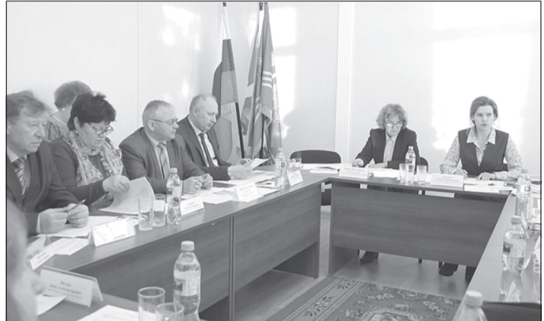
Совещание по вопросам готовности к переходу на цифровое телевидение