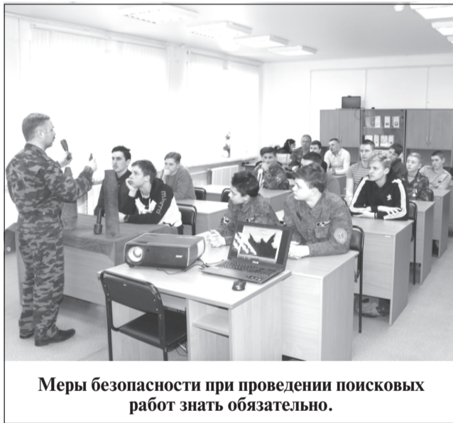
Меры безопасности при проведении поисковых работ знать обязательно.

В мастер-классах приняло участие более 110 обучающихся образовательных организаций (воспитанников патриотических клубов) из Иванова, Ивановского, Ильинского, Родниковского, Приволжского, Савинского, Комсомольского, Шуйского и Юрьевоцкого районов. Опытные поисковики рассказали и показали ребятам на практике как применяется в поисковых экспедициях специальная техника, снаряжение и оборудование, научили оказывать первую доврачебную по-