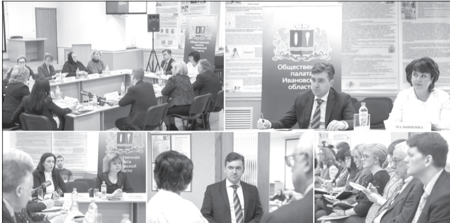
Губернатор Ивановской области Станислав Воскресенский провел встречу с активом Общественной палаты региона.

Губернатор Ивановской области Станислав Воскресенский провел встречу с активом Общественной палаты региона, на которой обсудили вопросы демографии и поддержки рождаемости.