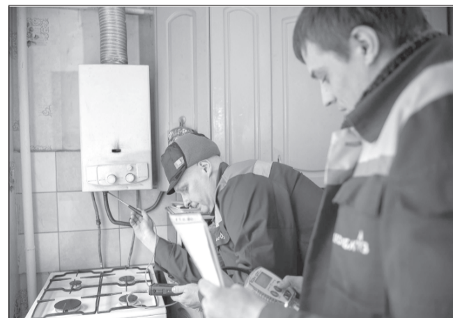
Проверка состояния внутридомового газового оборудования

разных уровней за счет штрафов поступило более 14 млн рублей. Также, для информирования граждан Ивановской области о качестве и эффективности работы управляющих компаний службой ГЖИ составлен рейтинг оценки эффективности деятельности управляющих компаний за 2018 год. Принято решение с этого года обновлять данный рейтинг ежеквартально. Добавим, что впервые был проведен сравнительный анализ показателей 2018 года с показателями за 9 месяцев 2018 года. В ходе анализа службе удалось оценить, как изменились показатели управляющих компаний за три месяца.