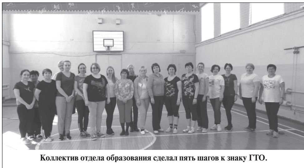
Коллектив отдела образования сделал пять шагов к знаку ГТО.

Призываем всех жителей района зарегистрироваться на сайте gto.ru и принять участие в выполнении испытаний комплекса ГТО.