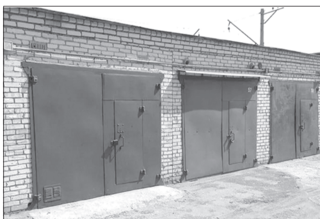
А у вас в порядке документы на гараж?

(Начало. Окончание в следующем номере газеты)